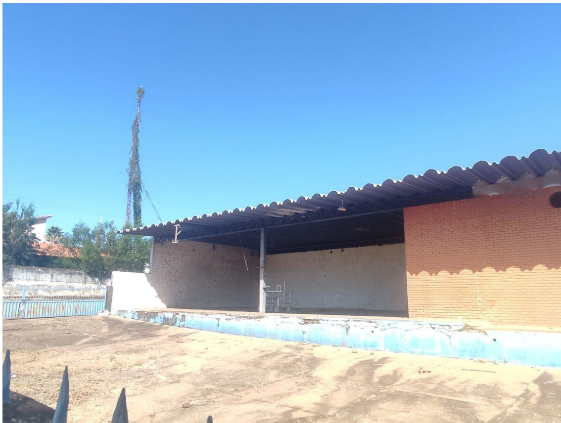
Figura 4 - Construção;