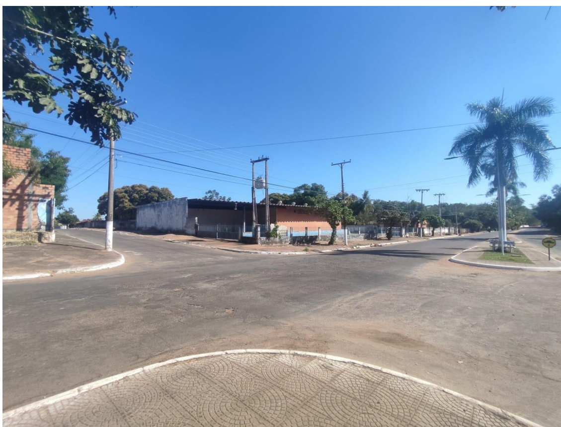
Figura 2 - Avenida Marechal Rondon;