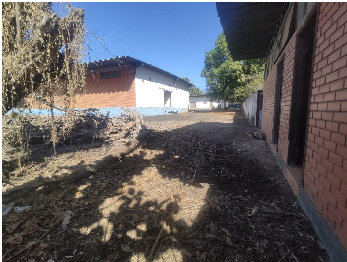
Figura 5 - Propriedade;