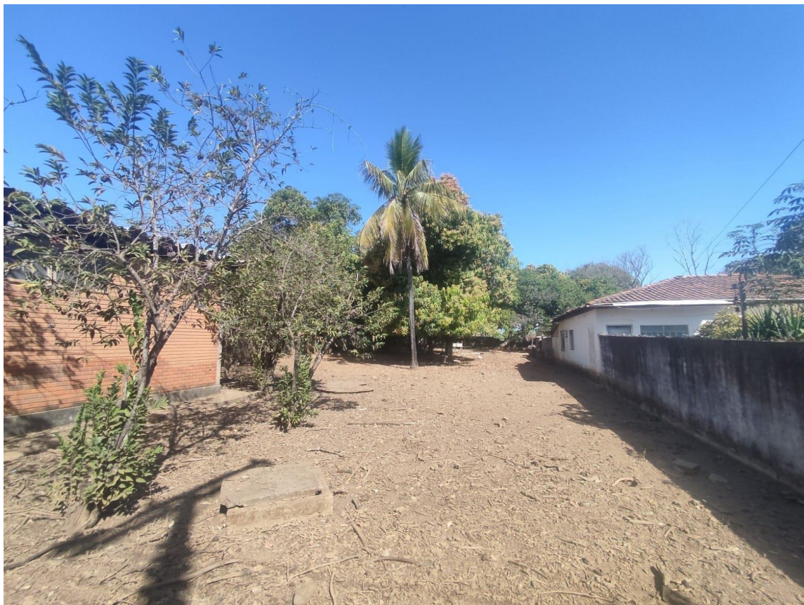
Figura 6 - Propriedade;