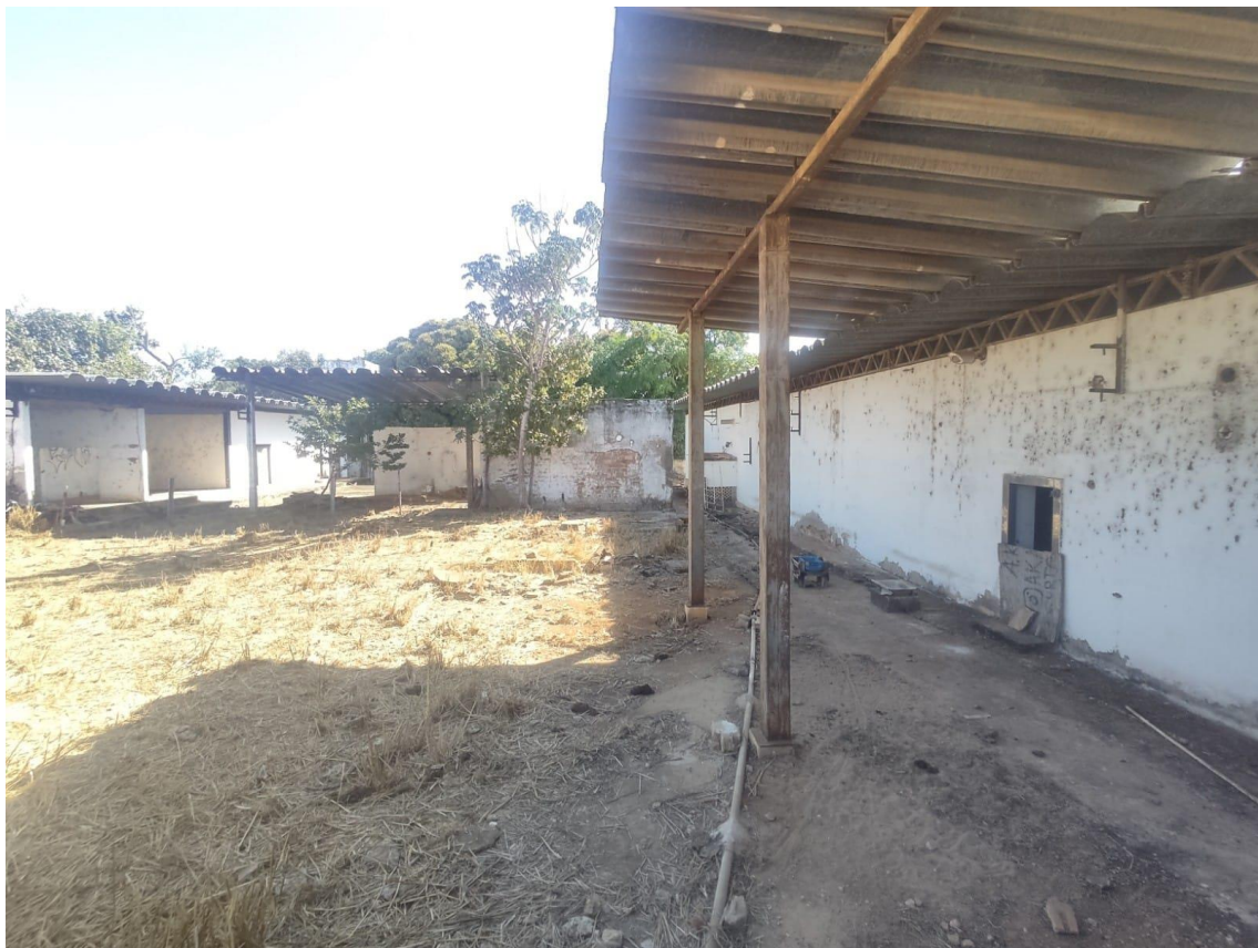
Figura 8 - Propriedade;