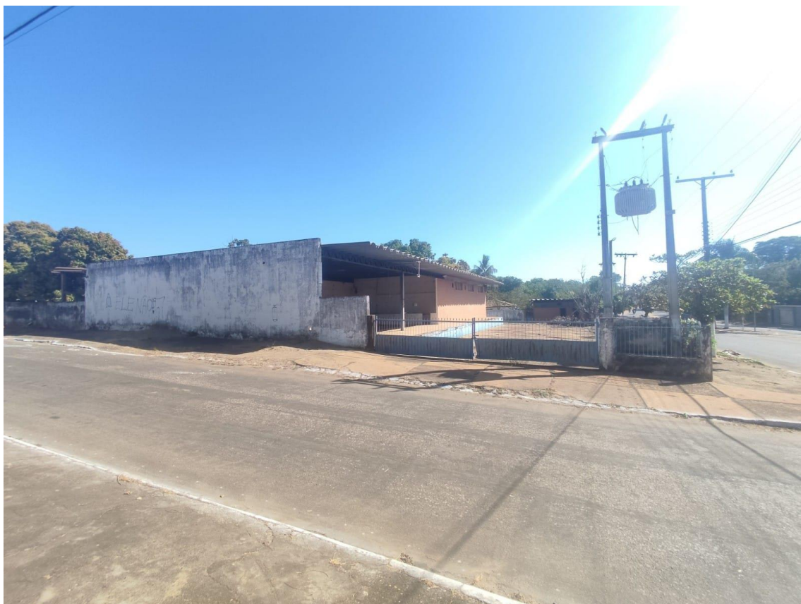
Figura 9 - Propriedade;