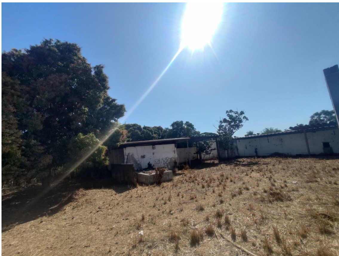
Figura 7 - Propriedade;