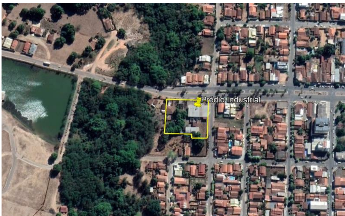
Figura 1 – Localização da Propriedade;