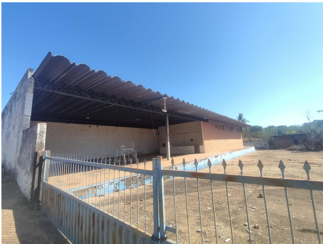
Figura 3 - Construção;